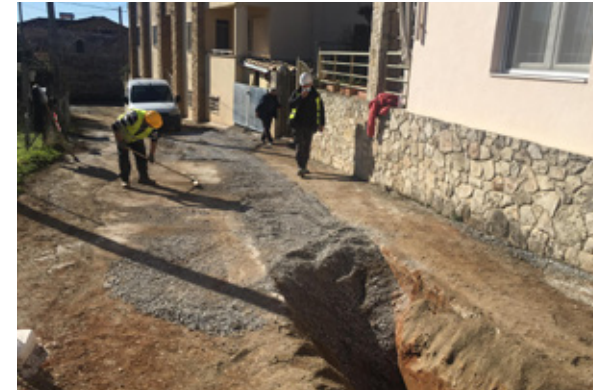
Το έργο περιλαμβάνει κατασκευή εσωτερικού δικτύου αγωγού αποχέτευσης ακαθάρτων συνολικού μήκους περίπου 5,3 χιλιομέτρων.

Με την ολοκλήρωση του έργου ο οικισμός της Λακκιάς ο οποίος σήμερα εξυπηρετείται με βόθρους, θα διαθέτει ένα σύγχρονο δίκτυο αποχέτευσης ακαθάρτων το οποίο θα συνδέεται με τον υφιστάμενο συλλεκτήρα στα Λουτρά Θέρμης, ενώ από εκεί τα λύματα θα παροχετεύονται στις εγκαταστάσεις του βιολογικού καθαρισμού. Πρόκειται για ένα έργο το οποίο αναμένεται να συμβάλει θετικά στη βελτίωση του βιοτικού επιπέδου των κατοίκων, αλλά και στην περιβαλλοντική ανάπτυξη της περιοχής. Παράλληλα, το γεγονός ότι θα γίνουν ιδιωτικές συνδέσεις των κατοίκων του οικισμού της Λακκιάς με το δίκτυο αποχέτευσης και θα καταργηθούν οι υφιστάμενοι βόθροι θα έχει ως αποτέλεσμα την προστασία των υπόγειων και επιφανειακών υδάτων.