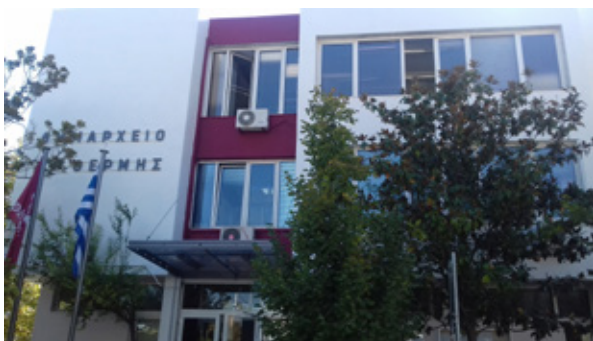
Μεταξύ των δήμων με τα χαμηλότερα δημοτικά τέλη στην περιφερειακή ενότητα Θεσσαλονίκης είναι ο δήμος Θέρμης.

Σταθερά διατήρησε τα δημοτικά τέλη ο δήμος Λαγκαδά. Στις κατοικίες υπάρχουν τρεις ζώνες με τιμές 1, 1,10 και 1,42 ευρώ/τ.μ. και στα καταστήματα οι χρεώσεις κυμαίνονται από 1,75 έως 2,12 ευρώ/τ.μ.