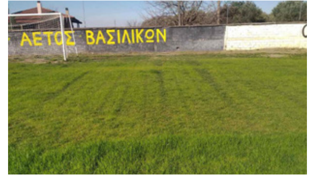
Ο δήμος Θέρμης αποκατέστησε τις ζημιές στο γήπεδο των Βασιλικών.

«Ο δήμος Θέρμης κατέθεσε, ως όφειλε, μηνύσεις και για τις δύο περιπτώσεις καταστροφής του αγωνιστικού χώρου των γηπέδων Βασιλικών και Ταγαράδων. Ελπίζουμε οι αρμόδιες αρχές να βρουν σύντομα τους υπαίτιους. Πέρα από τις όποιες συνέπειες προβλέπει ο νόμος σε αυτές τις περιπτώσεις, εμείς, ως δήμος, θα διεκδικήσουμε μέχρι και το τελευταίο ευρώ, αποζημιώσεις για τις ζημιές από αυτούς που τις προκάλεσαν. Είμαστε υποχρεωμένοι να προστατέψουμε την περιου-