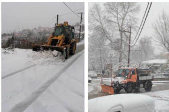
Τρεις ημέρες τα συνεργεία του δήμου εργάζονταν διαρκώς για να κρατήσουν ανοιχτούς τους δρόμους, κυρίως στους ορεινούς οικισμούς.

Αποτέλεσμα της άοκνης προσπάθειας των εργαζομένων αθλά και των εθελοντών Πολιτικής Προστασίας ήταν να παραμείνει ανοιχτό το βασικό δημοτικό οδικό δίκτυο καθώς και οι βασικοί δρόμοι σε κάθε Κοινότητα.