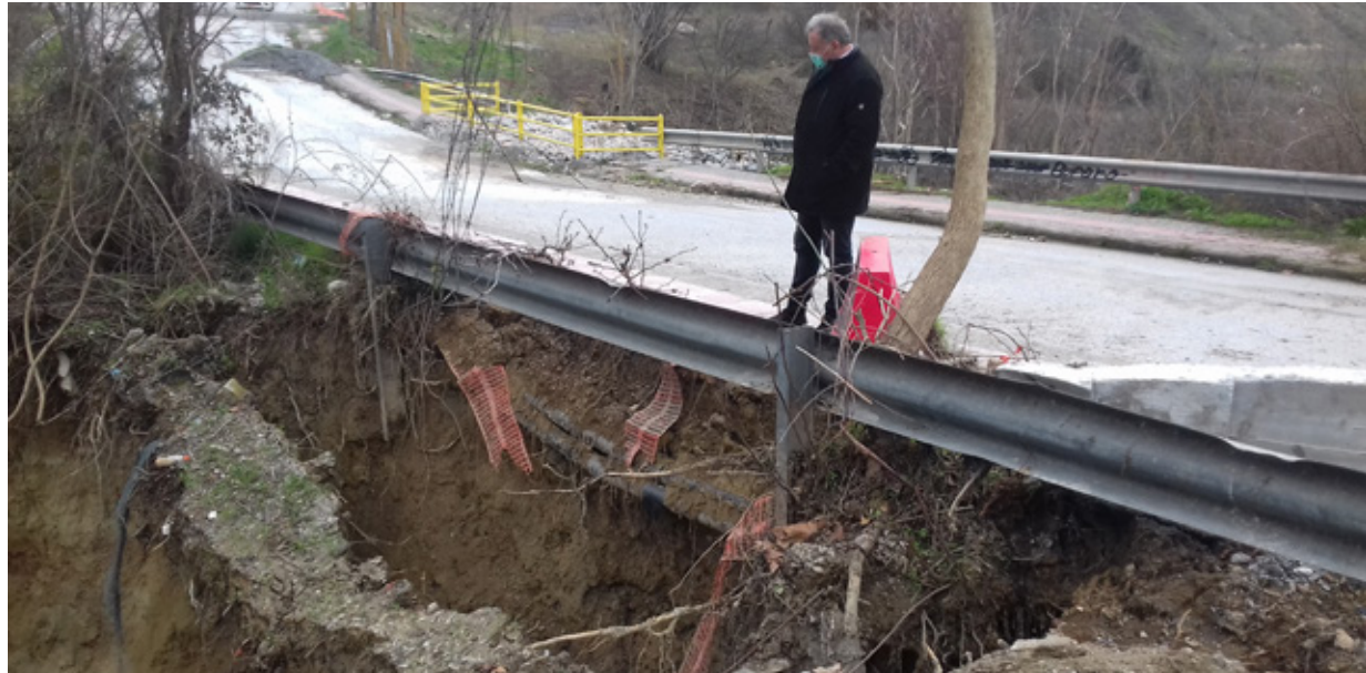
Ο δήμαρχος Θέρμης Θόδωρος Παπαδόπουλος στο σημείο της κατολίσθησης.

Υπενθυμίζεται ότι το πρόβλημα προέκυψε όταν, λόγω της πολύ ισχυρής βροχόπτωσης της 21ης Μαΐου 2020 σημειώθηκε τοπική κατολίσθηση στο χαμηλότερο σημείο του επικώματος όπου εδράζεται η οδός Περικλήους, που συνδέει τους οικισμούς Πλαγιαρίου και Τριλόφου. Αμέσως αποκόπηκε η κυκλοφορία, η οποία διοχετεύτηκε σε παρακαμπτήριους οδούς οι οποίες