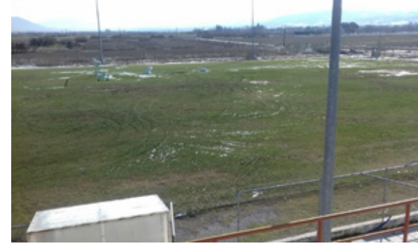
Η εικόνα του γηπέδου μετά την εισβολή των αγνώστων με αυτοκίνητο στον αγωνιστικό χώρο του γηπέδου των Ταγαράδων.