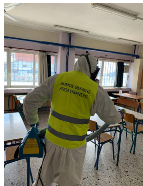
Πραγματοποιήθηκαν απολυμάνσεις σε όλα τα σχολεία.

Τα τεστ έγιναν από το ειδικό επιστημονικό προσωπικό του Ινστιτούτου Εφαρμοσμένων Βιοεπιστημών του Εθνικού Κέντρου Έρευνας και Τεχνολογικής Ανάπτυξης, στο πλαίσιο της συνεργασίας που έχει ο δήμος Θέρμης με το ΕΚΕΤΑ. Παράλληλα το Σάββατο 30 Ιανουαρίου, τρία συνεργεία, έκαναν απολυμάνσεις στα δεκατρία σχολικά κτίρια στα οποία λειτουργούν τα γυμνάσια και τα λύκεια καθώς και το ΕΠΑΛ στο δήμο Θέρμης. Παραδόθηκαν, επίσης στους διευθυντές των σχολείων αντισηπτικά και όλα τα αναγκαία μέσα καθαρισμού, καθώς και προστατευτικές μάσκες για μαθητές και εκπαιδευτικούς, τις οποίες είχε αποστείλει το προηγούμενο διάστημα η Κεντρική Ένωση Δήμων Ελλάδας.