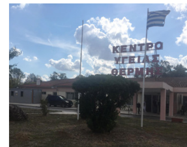
Στο δήμο Θέρμης οι εμβολιασμοί γίνονται στο Κέντρο Υγείας.

την ίδια διαδικασία για το κλείσιμο του δεύτερου ραντεβού, όμως δεν μπορείτε να επιλέξετε σε αυτή την φάση ημερομηνία, διότι το σύστημα θα καταχωρήσει από μόνο του την προβλεπόμενη ημερομηνία για την δεύτερη δόση του εμβολίου.