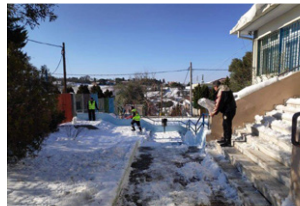
Την Κυριακή 17 Ιανουαρίου καθαρίστηκαν όλες οι αυλές των σχολείων και την επομένη λειτούργησαν κανονικά.