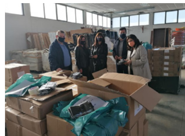
Με την επαναλειτουργία των δημοτικών σχολείων μοιράστηκαν μάσκες σε μαθητές και εκπαιδευτικούς.

Ανάλογες ενέργειες έγιναν και πριν από την επαναλειτουργία των γυμνασίων και λυκείων. Στο πλαίσιο αυτό, στις 22 Ιανουαρίου έγινε νέος κύκλος ελέγχου για covid-19 για όλο το προσωπικό το οποίο απασχολείται